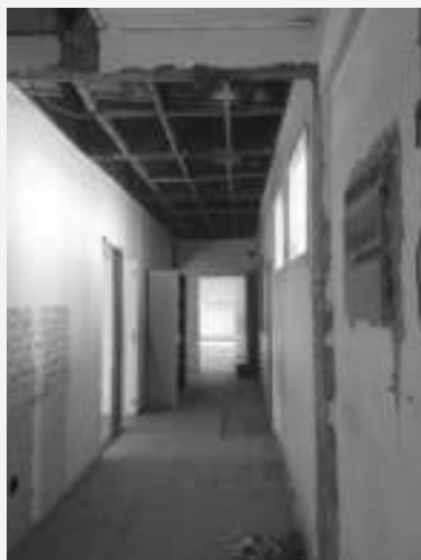
Couloir d'accès aux salles de réunion