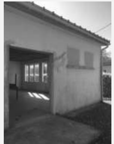
Sortie de la salle St J M Vianney