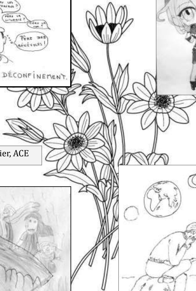
Dessins : J.Dieu, J.J.Olivier, ACE