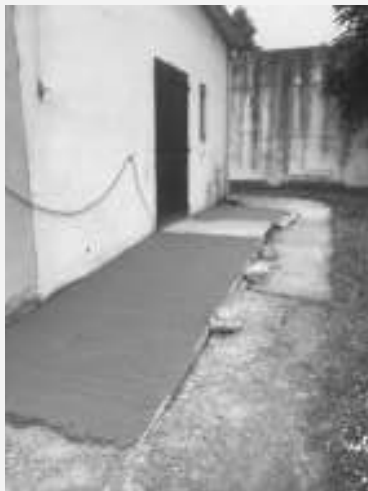
Rampe d'accès et nouvelle porte d'entrée du bâtiment

Depuis plusieurs mois un projet de réhabilitation et de mise aux normes des Etablissements Recevant du Public du plus ancien bâtiment du site de St J M Vianney avait été déposé auprès de l'archevêché de Bordeaux et reçu de celui-ci un avis favorable sur le plan de financement.